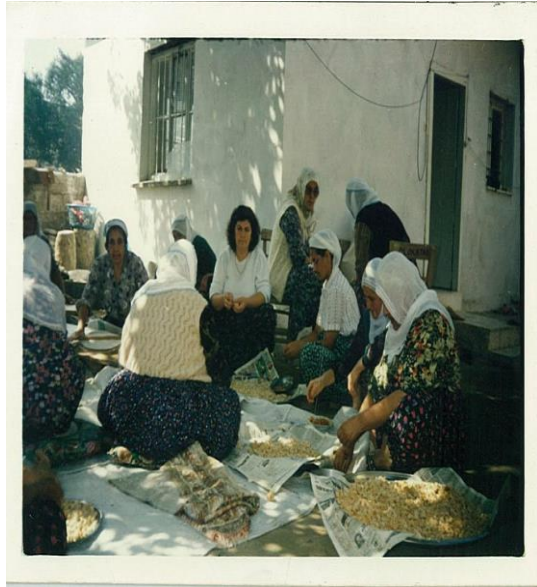
EK.2: Günlük hayatta kullanılan kadın şalvarları 3

Çukurova erkek şalvarını tamamlayan giyim-kuşam kıyafetleri ise genellikle başa giyilen kasket, terlik, mintan adı verilen gömlek (genellikle açık renkli) ve Tarabulus kuşaktır. Tarabulus kuşak çok amaçlı kullanıma sahip olup ipeksi, işlemeli bir kumaştır. "İki kenarı püsküllüdür. Rengi sade beyaz, kahverengi, siyah olabildiği gibi karışık çizgili desenli de olmaktadır. Renklerin karışımı gök kuşağını andırmaktadır. Osmaniye'de genellikle sade beyaz olanı bele bağlamada, siyah olanı ise boyuna atılmaktadır. Tarabulus kuşak, cepken etekleri şalvarın içine sokularak üzerinden bele bağlanır. Püsküllü şalvar üzerine sarkacak şekilde bağlanır" (Artun, 2008: 82). Çukurova erkek şalvarı kadın şalvarına nazaran renk olarak daha koyudur. "Tırlık denen bir tür pamuklu dokumadan yapılmaktadır. Tırlık ıstar denen el tezgâhlarında dokunmaktadır. Iygısı da çözgüsü de pamukludur. Ancak, tırlık kumaş günümüzde üretilmediğinden, yerini 'tırpanı bez' 'terikoton' ve çeşitli pamuklu ve yün kumaşlardan yapılmaktadır. 'Gara şalvar' en çok kullanılanıdır. Zeytin yeşili ve kahverengi kumaşlardan da yapılmaktadır" (Artun, 2008: 89).