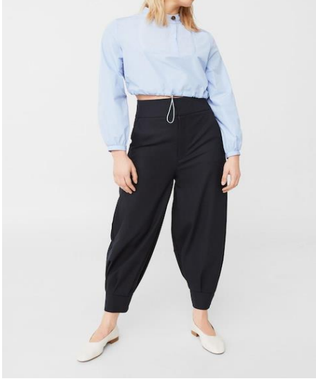
EK 3: Puplin Şalvar 4