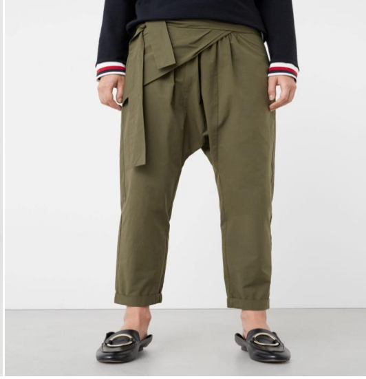
EK 4: Dökümlü Şalvar 5

erkekler için takım elbiseyle yarışabilecek bir zarafetin ölçüsü olarak karşımıza çıkabiliyor" (Anadolu Jet Magazin,2015). "Kültür, toplumsal anlamda katılımın olduğu dönemlerde ilkel topluluktan Ortaçağ topluluğunun sonlarına kadar belirli bütünlüğe sahip olmuştur. Yani, kültürel etkinlik önce tasarım aşamasından geçmiş, daha sonra bu tasarıma uygun bir üretim yapılmış ve sonunda da toplu olarak tüketilmiştir. İş bölümü ve uzmanlaşmanın gelişmesiyle birlikte kültürel yapıda da çeşitli değişimler meydana gelmiştir. Bu duruma bağlı olarak yeni bir kültürel yapılanma oluşmuştur. Bu yeni yapılanma içinde tasarım, üretim ve tüketim birbirinden ayrılmış, bunlara ek olarak da daha önce ismi anılmayan yeni bir olgu olarak dağıtım eklenmiştir. Böylelikle kültürel süreç tüketim aşamasıyla sona eren bir süreç olmaktan çıkmıştır. Tüketiciden tekrar tasarım yapana ve üreticiye dönüşen bir döngüye sahip olmuştur" (Özkök, 1985: 106).